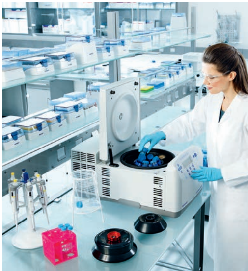
Многофункциональная микроцентрифуга с охлаждением 5430R с ротором F-35-6-30 для конических пробирок объёмом 15 и 50 мл (на фото)