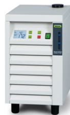
Recirculating Chiller F-100 / F-105 Самый легкий способ охлаждения