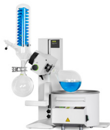
Rotavapor® R-100 Экономичное упаривание