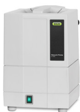
Vacuum Pump V-100 Экономичный источник вакуума