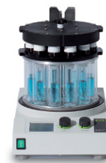
Multivapor™ P-6 / P-12 Эффективное испа- рение нескольких образцов