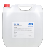
PDS-10L BS-040107-FK раствор для дезактивации ДНК/РНК 10л