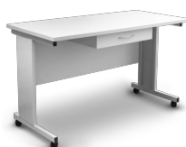
T-4L BS-040107-BK Стол

Новая модульная конструкция лабораторной мебели обеспечивает гибкость и легкость в использовании.