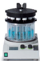
Multivapor™ P-6 / P-12

Удобное и эффективное ротационное упаривание