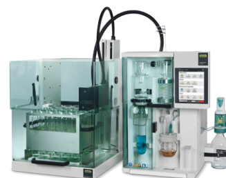
KjelMaster System K-375 / K-376 / K-377

Паровая дистилляция, титрование и автоподача