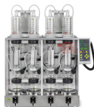
Extraction Systems B-811 / B-811 LSV

Эффективное упаривание нескольких образцов