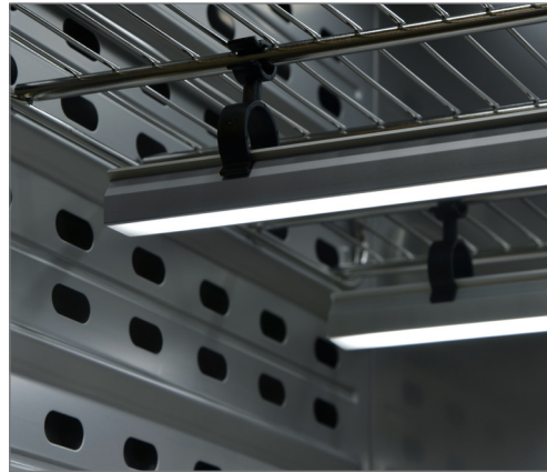
Световая планка 60 см, прикреплена при помощи пластиковых зажимов® к решетчатой вставной полке