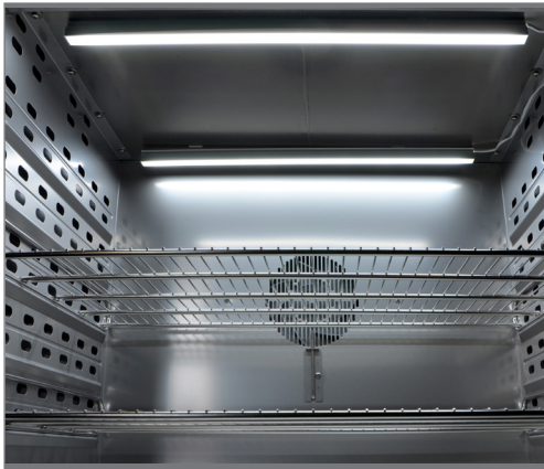
Световая планка 60 см, прикреплена при помощи tesa Powerstips® к потолку камеры