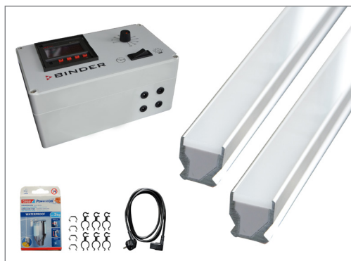
Комплект поставки базового набора