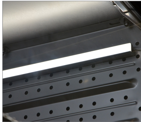
Световая планка 30 см, прикреплена при помощи tesa Powerstips® к стенке камеры