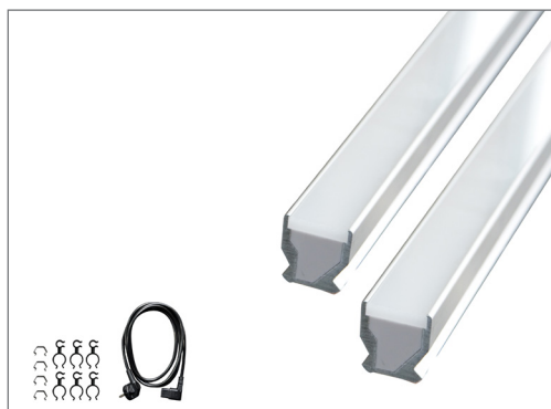
Комплект поставки набора для расширения